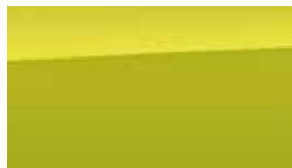
Galben Acid Metalic/ Perlat (W9Y)