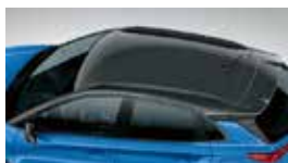
Gri Dark Knight