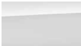
Alb Chalk Metalic (P6W)