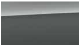
Gri Galactic Perlat (R3G)