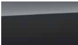
Gri Dark Knight Perlat (YG7)