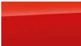
Roșu Tangerine Perlat (TA9)