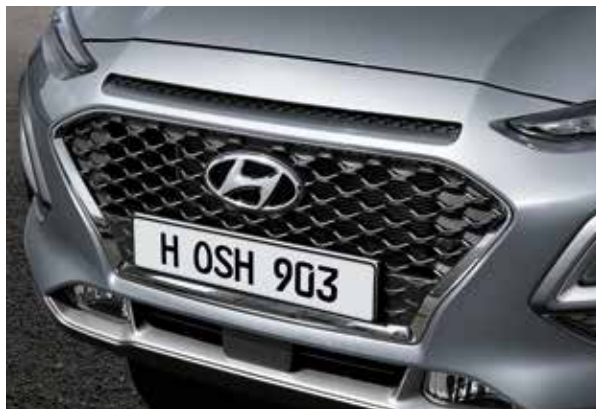
Grilă tip cascadă