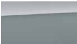
Argintiu Lake Metalic/ Perlat (SS7)