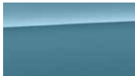
Albastru Ceramic Perlat (SU8)