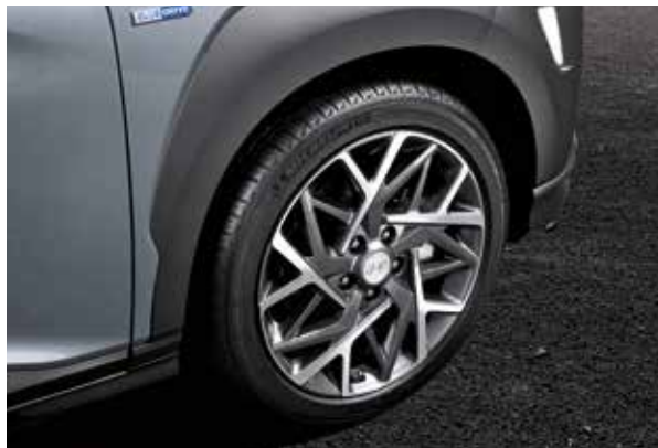
Jante din aliaj de 18"