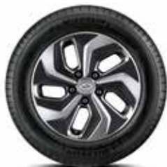
Jante din aliaj de 16"

Lumini spate cu LED Încărcare wireless Scaune spate încălzite Frână de mână electrică