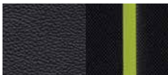
Material textil și piele - inserții de culoare verde Lime