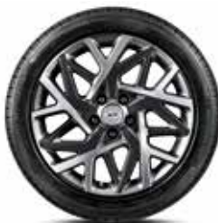
Jante din aliaj de 18"