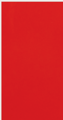
Roșu Tomato Solid (TTR)