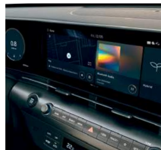
Ecran de 12,3 inchi