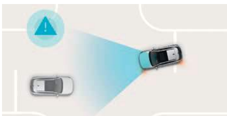
Sistem de asistență la coliziunile frontale (FCA) cu funcție de prevenire a coliziunilor în intersecții