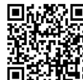
Anvelope 215/55 R18

Informațiile prezentate în acest pliant se bazează pe datele disponibile la momentul publicării. Acestea sunt orientative și nu reprezintă parte integrantă a ofertei de produs. Este posibil ca unele echipamente ilustrate sau prezentate să nu fie disponibile în echiparea standard, putând fi achiziționate contra cost. Hyundai Auto România își rezervă dreptul de a schimba specificațiile tehnice și echipările fără un anunț prealabil. KONA dispune de pachetul de 5 ani garanție fără limită de kilometri, alături de garanția extinsă de 8 ani sau 160.000 de km pentru bateria litiu-ion polimer de înaltă tensiune. Garanția de 5 ani fără limită de kilometri se aplică doar autovehiculelor Hyundai care au fost vândute inițial de către distribuitorul autorizat Hyundai către clientul final, conform termenilor și condițiilor prezentate în pașaportul de service. Pentru informații complete, vă rugăm să contactați distribuitorii Hyundai Auto România. Imaginile disponibile sunt cu titlu de prezentare.