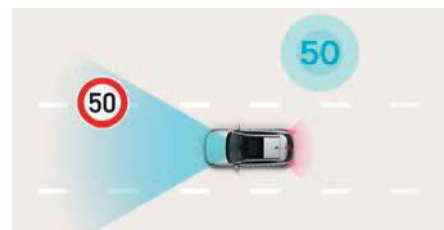
Funcție inteligentă de avertizare asupra vitezei limită (ISLA)