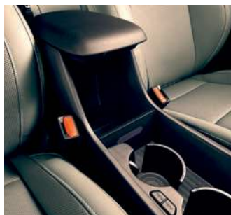
Consolă centrală deschisă cu suporturi rotative pentru pahare