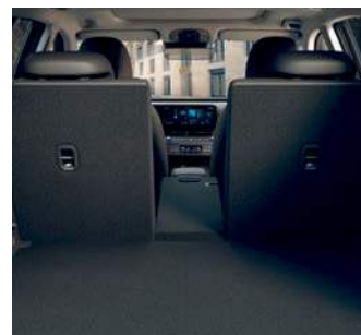
Capacitate portbagaj – 407 l