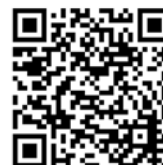
Anvelope 215/60 R17