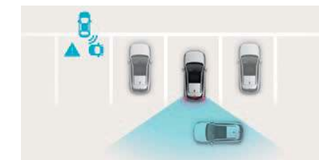
Sistem de asistență pentru evitarea unei coliziuni la deplasarea în marșarier (RCCA)