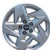
Jante aliaj 17"