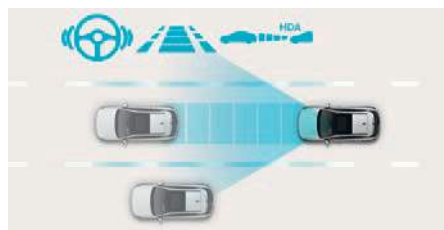
Sistem de asistență pentru condusul pe autostradă (HDA 1.5)