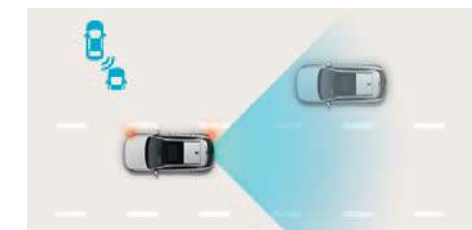
Sistem de asistență la evitarea coliziunilor în unghiul mort (BCA)