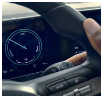
Padele pe volan