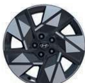
Jante aliaj 18"