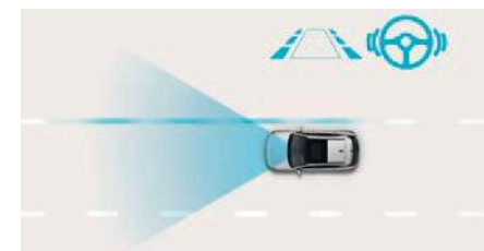
Sistem de asistență pentru păstrarea benzii de rulare (LKA)