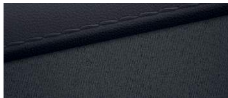
Material textil (II)

Mostrele de culoare prezentate pot varia ușor față de cele reale, din cauza condițiilor de iluminare și a procesului de tipărire. Pentru informații complete cu privire la disponibilitatea culorilor și a tapițeriei, vă rugăm să contactați distribuitorii Hyundai Auto România.