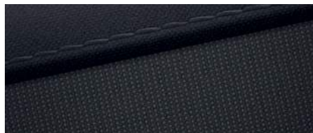
Material textil (I)