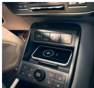
Sistem de încărcare wireless